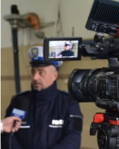
„Twoje światła - Twoje bezpieczeństwo” #3