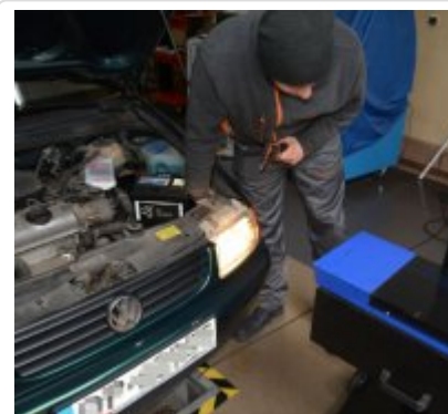
„Twoje światła - Twoje bezpieczeństwo” #7