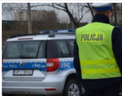
„Twoje światła - Twoje bezpieczeństwo” #5