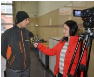
„Twoje światła - Twoje bezpieczeństwo” #9