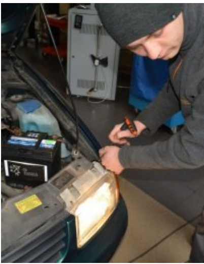
„Twoje światła - Twoje bezpieczeństwo” #8