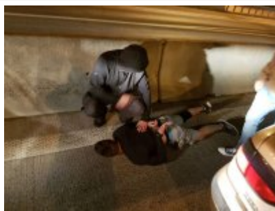
Falszywi policjanci już zatrzymani