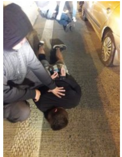
Falszywi policjanci już zatrzymani