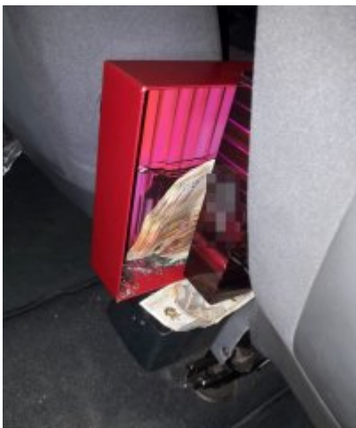
Falszywi policjanci już zatrzymani