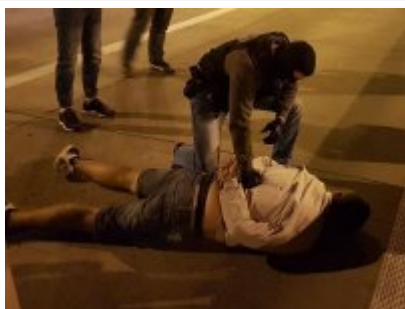
Falszywi policjanci już zatrzymani

Tylko we wrześniu, oszuści w naszym regionie próbowali oszukać kilkadziesiąt osób z czego 3 skutecznie.