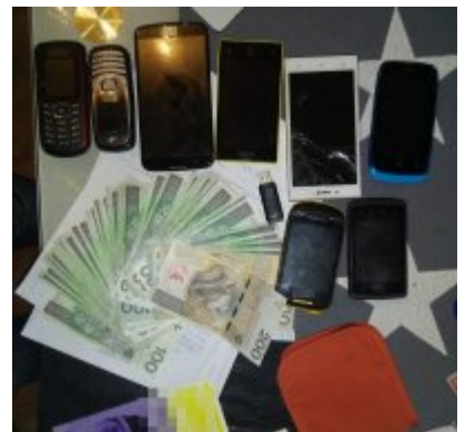
Falszywi policjanci już zatrzymani