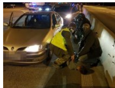
Falszywi policjanci już zatrzymani