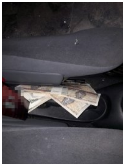
Falszywi policjanci już zatrzymani