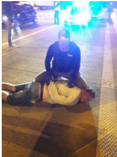
Falszywi policjanci już zatrzymani